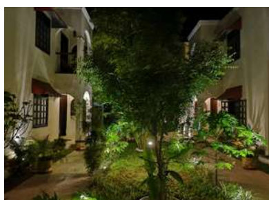
Hôtel de Sak-I

Tulum et Mérida : en hôtels avec chambres multiples, de qualité correcte.