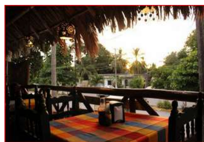
Restaurant sous les palapas