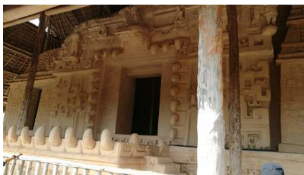
Temple de Ek Balam