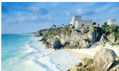
Le site de Tulum