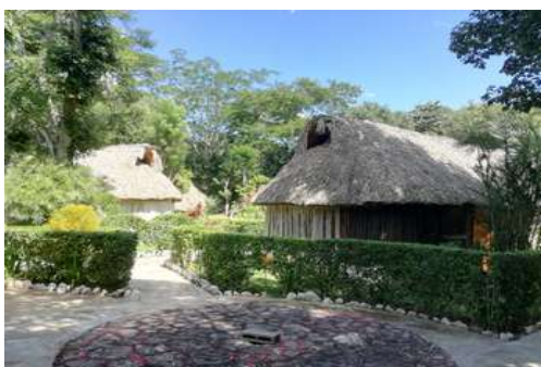
Hébergements de Ek Balam

Les repas seront pris dans des restaurants ou dans la rue pour Tulum et Mérida, ce que nous déciderons ensemble sur place ; vous serez libres d'adapter à votre budget. Par contre les repas à Ek Balam sont sur place, sauf sortie à la journée.