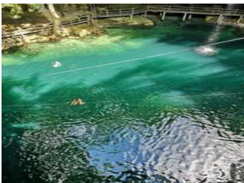
Cenote de Ek Balam

Il permettra de découvrir une autre facette de la tradition, différente de celle que j'utilise (qui elle-même est différente de l'originale). Ce sera un moment important du voyage.