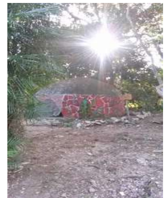
Temazcal de Ek Balam