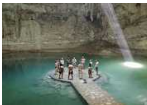
Cérémonie dans un cenote sacré

La spiritualité se vivra de façon fluide, joyeuse et ancrée dans la vie réelle, chaque instant étant un nouveau départ, chaque jour le premier du reste de votre vie. Alors prenez ce temps qui vous est offert pour rayonner votre vie pleinement et en conscience.