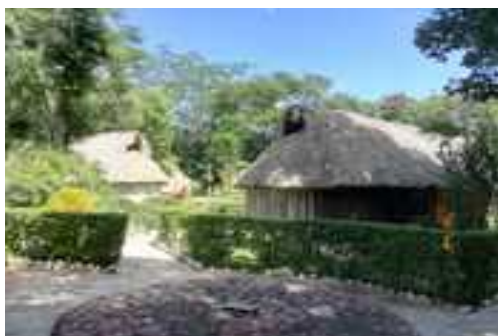
Hébergements de Ek-Balam

Les repas seront pris dans des restaurants ou autres pour Tulum, vous serez ainsi libres d'adapter à votre budget. Par contre les repas à Ek Balam sont à la communauté (sauf sortie à la journée), végétariens sur demande.