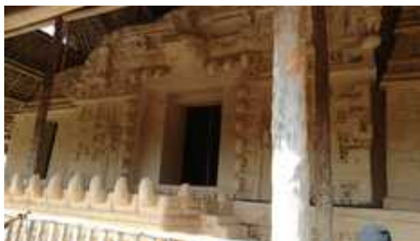
Temple de Ek-Balam