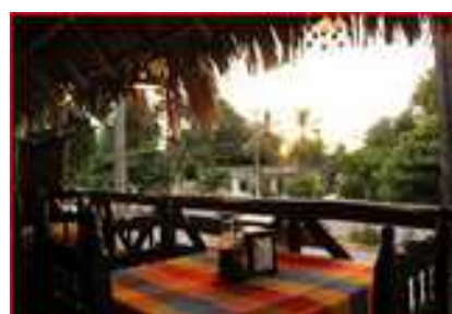
Restaurant sous les palapas

Merci de me contacter par mail ( loupbleu11@yahoo.fr ), messenger ( Bartolomé Cerlom) ou téléphone (06 29 16 32 66) si vous êtes intéressés ou souhaitez des précisions.