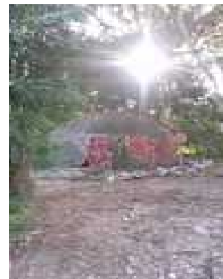
Le temazcal est prêt pour la cérémonie