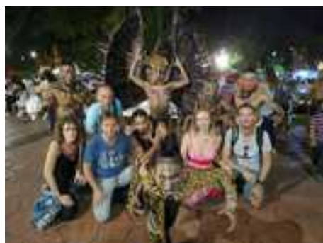
Un groupe avec les guerriers mayas