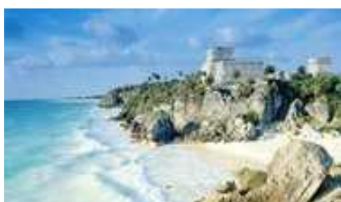
Le site de Tulum en bord de mer