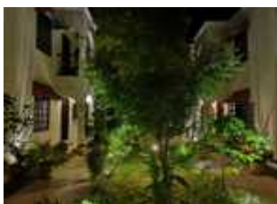
Hôtel de Sak-I

Attention, si vous atterrissez à Cancun, il y a des frais de déplacement jusqu'à Tulum, voir même un hébergement sur place. Mais il n'est pas évident de trouver des billets pour Tulum.