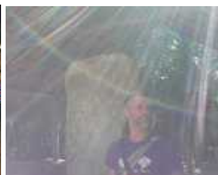
Dans la vieille cité de Coba