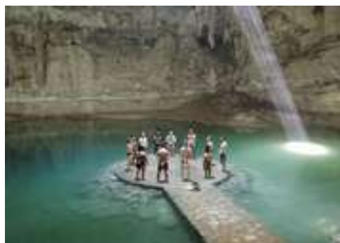
Cérémonie dans un cenote sacré

La spiritualité se vivra de façon fluide, joyeuse et ancrée dans la vie réelle, chaque instant étant un nouveau départ, chaque jour le premier du reste de votre vie. Alors prenez ce temps qui vous est offert pour rayonner votre vie pleinement et en conscience.