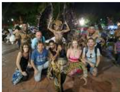
Un groupe avec les guerriers mayas