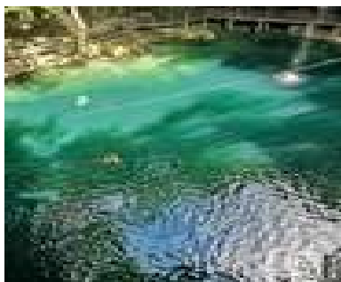
Les eaux turquoises du cenote de Ek-Balam

A cela s'ajouteront des cérémonies (lever du Soleil, connexion aux éléments,...) selon le lieu et le moment.