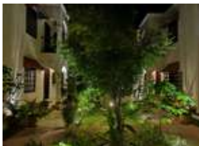
Hôtel de Sak-I

Attention, si vous atterrissez à Cancun, il y a des frais de déplacement jusqu'à Tulum, voir même un hébergement sur place. Mais il n'est pas évident de trouver des billets pour Tulum. Nous pourrions voir cela ensemble.