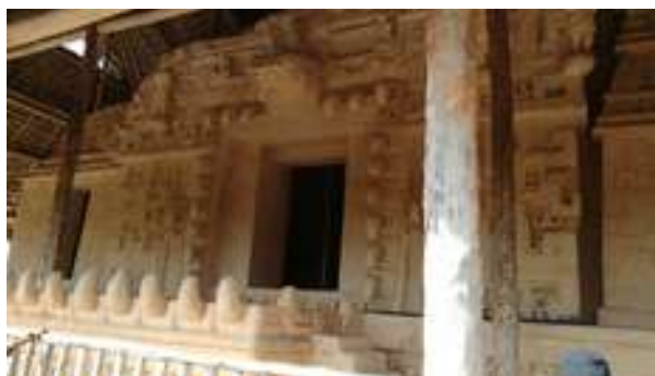
Temple de Ek-Balam