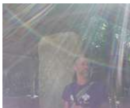
Dans la vieille cité de Coba