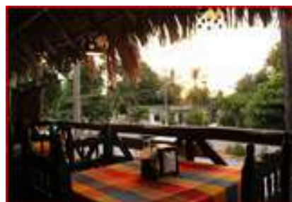
Restaurant sous les palapas

Merci de me contacter par mail ( loupleu11@yahoo.fr ), messenger ( Bartolomé Cerlom) ou téléphone (06 29 16 32 66) si vous êtes intéressé.e ou souhaitez des précisions.