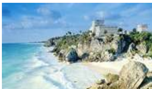
Le site de Tulum en bord de mer