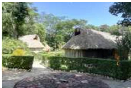
Hébergements de Ek-Balam

Les repas seront pris dans des restaurants ou autres pour Tulum, vous serez ainsi libres d'adapter à votre budget. Par contre les repas à Ek Balam sont à la communauté (sauf sortie à la journée), végétariens sur demande.