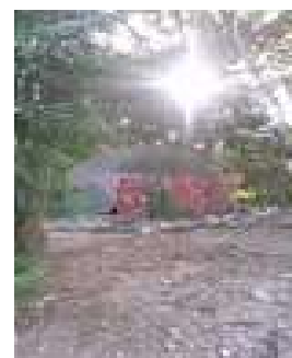
Le temazcal est prêt pour la cérémonie